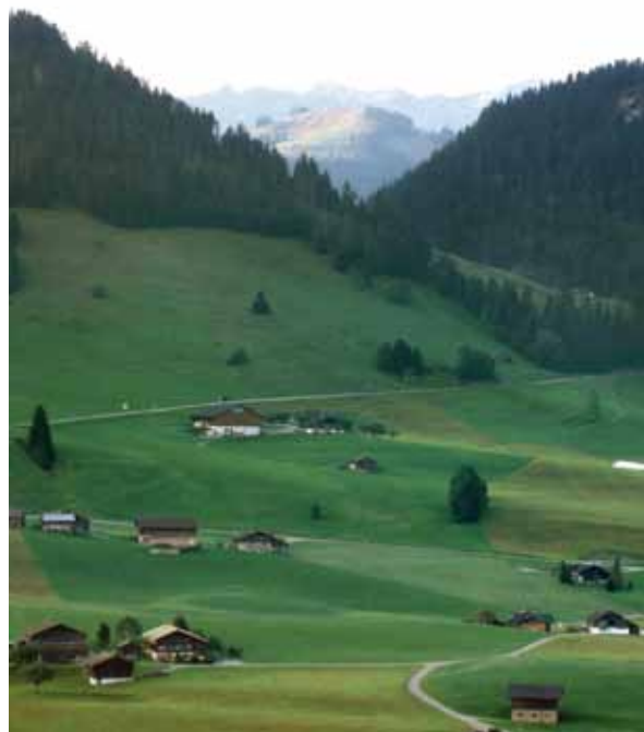
Le développement de régions à habitat dispersé doit être conçu avec soin.

Comme il s'agissait d'un terrain de recherche concret, nous voulions développer des propositions qui soient les plus pratiques possibles, ce qui n'est réalisable qu'avec l'implication du savoir et de l'expé-