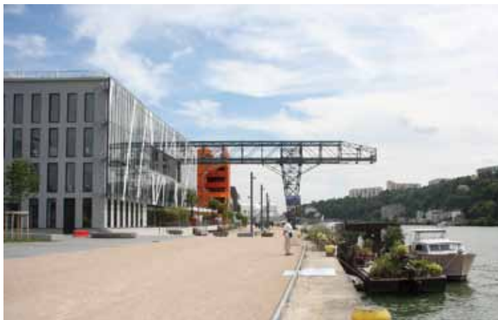
Lyon tente de plus intégrer ses fleuves au sein de la ville.