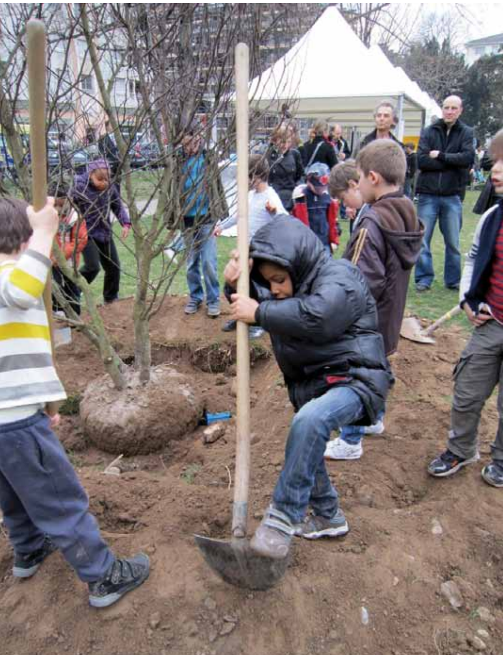
Des enfants participent à la plantation d'un arbre dans leur quartier.