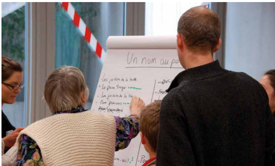
Les futurs jardiniers ont baptisé leur potager urbain lors de la démarche participative du 29 janvier au Grand-Saconnex.